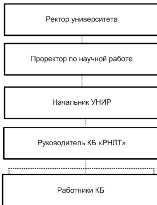
Рисунок 1 – Схема организационной структуры КБ «РНЛТ» 1

8.2. Структура управления КБ «РНЛТ» (рис. 1), штатная численность и соответствующие изменения определяются приказом ректора Университета. Выписка из штатного расписания на текущий календарный год находится в подразделении и рассматривается как неотъемлемая часть настоящего положения.