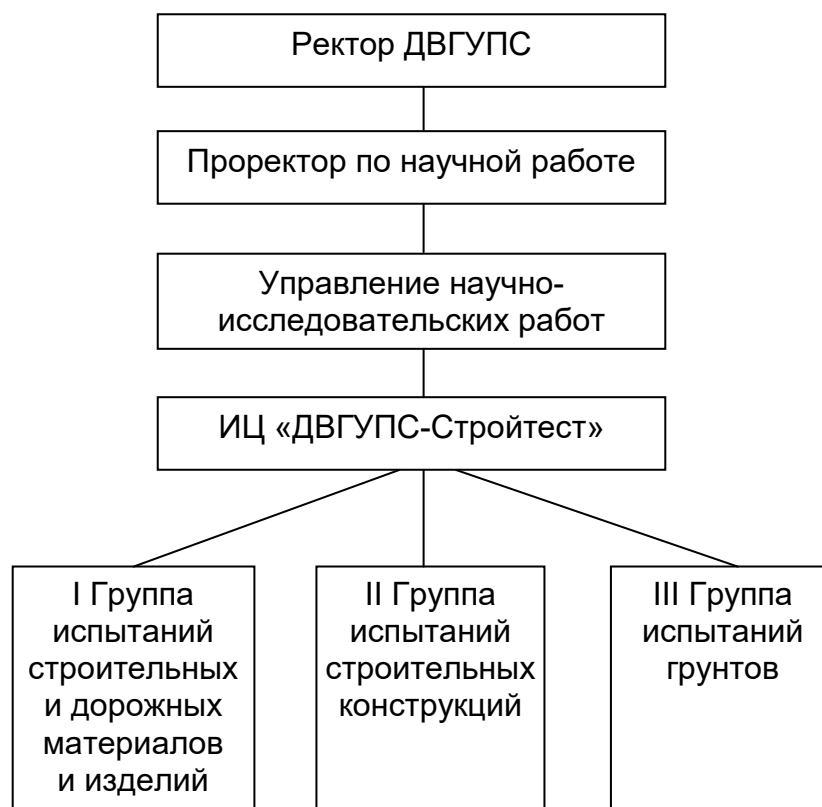
Рисунок 1 «Схема организационной структуры подчиненности ИЦ»

3.2. Структура ИЦ «ДВГУПС-Стройтест» (рис.1), штатная численность и соответствующие изменения определяются приказом ректора Университета. Выписка из штатного расписания на текущий календарный год находится в подразделении и рассматривается как неотъемлемая часть настоящего Положения.