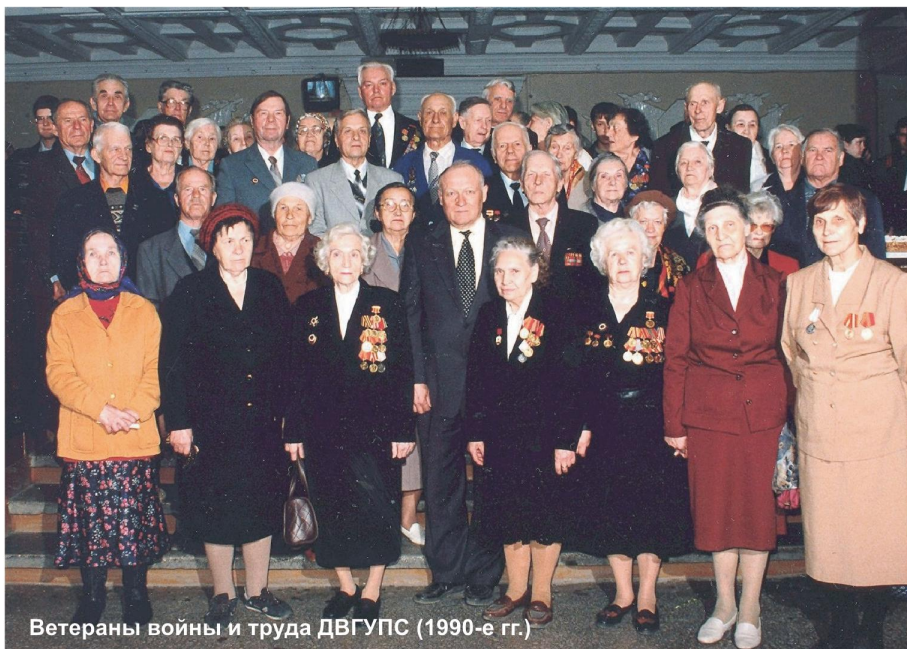
Ветераны войны и труда ДВГУПС (1990-е гг.)